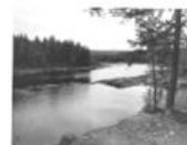
Bofors en by vid Vängelälven